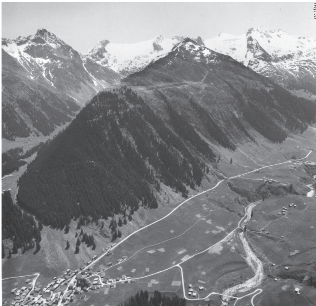
Abb.2 Potentieller Lawinenschutzwald: Links im Bild ist der Wald bis zur Krette geschlossen, die Waldgrenze liegt höher als die Krette. In der Mitte ist die Krette höher als die Waldgrenze, oberhalb der Waldgrenze ist noch ein Anrissgebiet für Lawinen vorhanden. Es hat nur noch an besonders günstigen Stellen Wald. Dies muss bei der Entscheidungsfindung im Wald berücksichtigt werden.

Die Situation an der Waldgrenze muss bei der Entscheidungsfindung in den Wäldern darunter berücksichtigt werden. Unter Umständen kann auch mit Hochlagenaufforstungen eine Verbesserung erreicht werden. Im Bereich der Waldgrenze nimmt der mögliche Deckungsgrad des Bestandes und damit auch tendenziell die Lawinenschutzwirkung ab. Ist oberhalb der potentiellen Waldgrenze ein Lawinenanrissgebiet vorhanden, so beschränkt sich das Aufkommen des Waldes darunter auf günstige Standorte wie Rippen (vergleiche Abb.2).